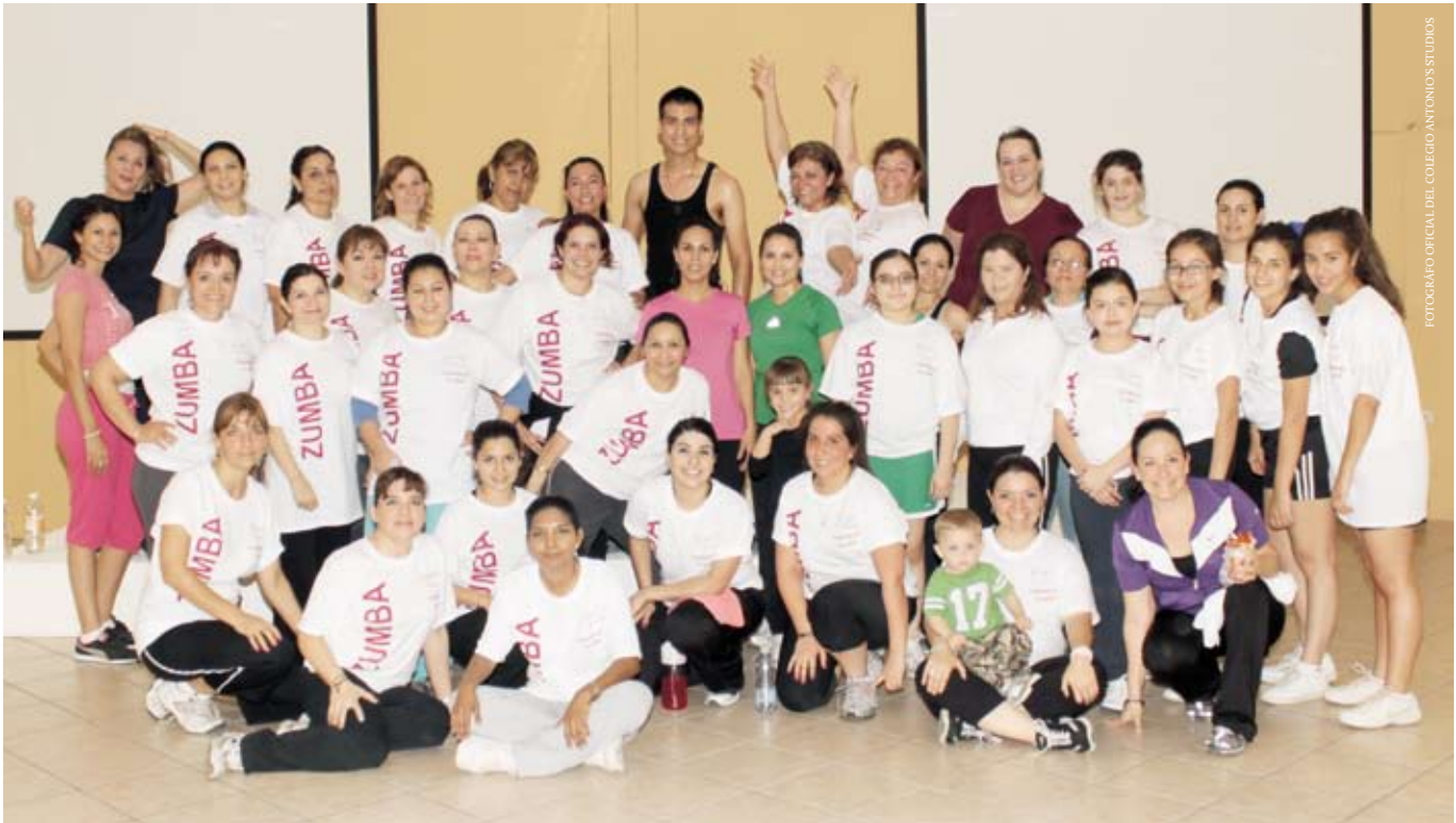
FOTOGRAFIO OFICIAL DEL COLEGIO ANTONIO'S STUDIOS