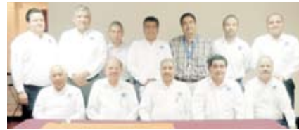
Grupo de Estudio de los martes Colegio de Contadores Públicos de Sonora

Ahora bien, y de conformidad con el artículo 240 del Reglamento de la (LISR), también se consideran gastos a que hace alusión la fracción I del artículo 176 de la (LISR), los siguientes: