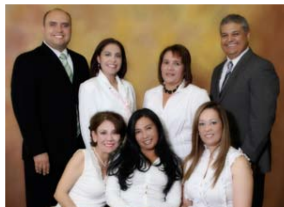
Presidentes de comisiones integrantes de la Vicepresidencia de Relaciones y Difusión

Invitamos cordialmente a los socios a integrarse a las diversas comisiones que conforman la Vicepresidencia de Relaciones y difusión. A